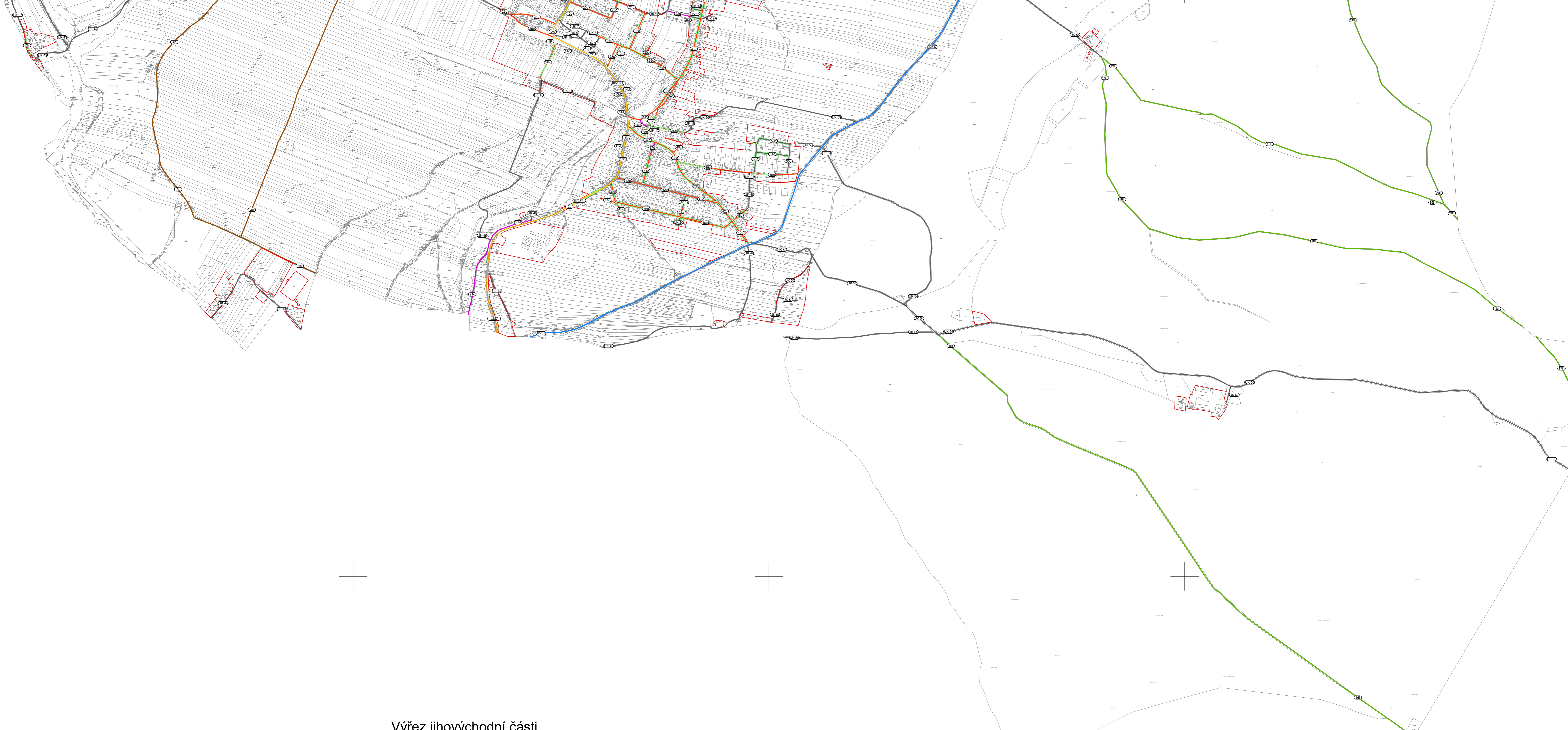
Výřez jihovýchodní části